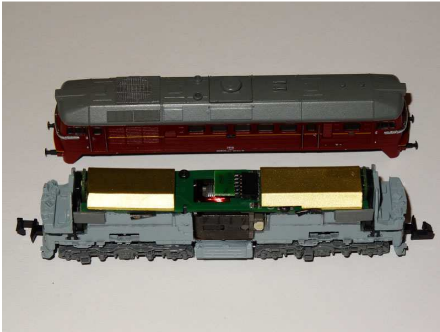
(Abb. Eingelegte Ballaste)